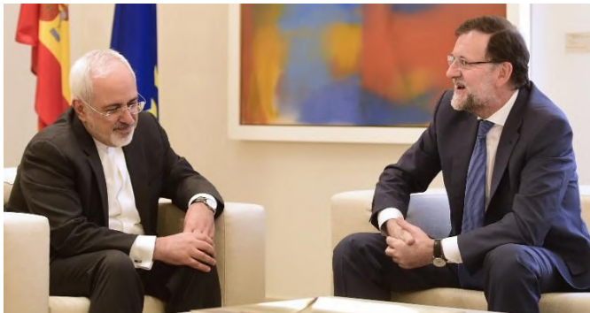
El anterior presidente del Gobierno, Mariano Rajoy junto al entonces ministro de Exteriores iraní, Mohammad Javad Zarif, durante la entrevista mantenida en Madrid el 14 de abril de 2015.