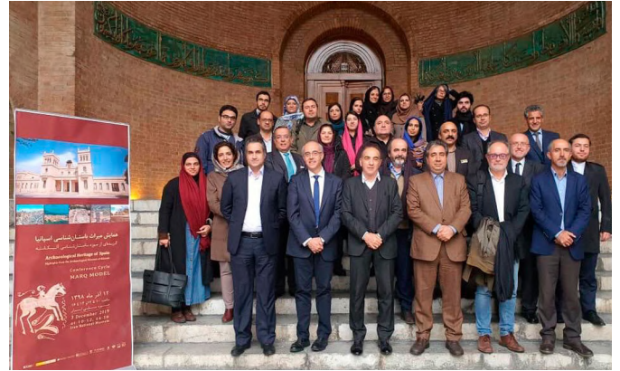
Grupo del Museo Nacional de Teherán, con los conferenciantes de Alicante, - septiembre 2019.

El 19 de mayo de 2024, el helicóptero de la Fuerza Aérea de Irán en el que viajaban el Presidente Raisi, el MAE Hossein Amir-Abdollahian, se estrelló en Azerbaiyán Oriental, causando su muerte. El accidente fue atribuido a “complejas condiciones climáticas”, según el informe final del Estado Mayor de las Fuerzas Armadas publicado en septiembre, descartando sabotaje o ataque.