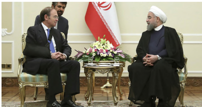
El entonces presidente del Senado español, Pío García-Escudero, conversa con el anterior presidente iraní, Hasan Rohaní, en un encuentro en Teherán.- 5 agosto 2017.-@EFE