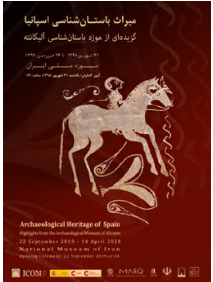
Cartel Exposición Arqueológica Alicante Tesoros del MARQ.- 22/09/2019.- Museo Nacional de Irán

Respecto a Egipto, con la llegada al poder de los Hermanos Musulmanes, y aún después de su caída, Irán ha intentado un acercamiento, con resultados