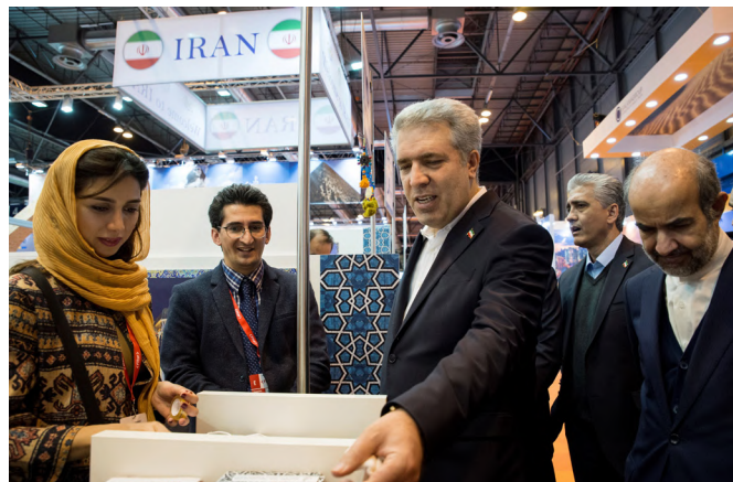
El anterior vicepresidente de Irán, Ali asghar Mounesan, durante la visita que realizó al stand de su país en Fitur, Madrid.-17 enero /2018.

se encuentra en Teherán. También destaca la adscripción de Irán al club de países ribereños del Caspio y al Developing 8, entidad que agrupa a ocho países musulmanes de distintas partes de mundo y de cierta entidad demográfica. Irán forma parte de la Organización de la Conferencia Islámica (OCI), en donde comparte asiento con todos sus vecinos árabes, por lo que es un importante foro de interlocución. En materia energética, Irán es miembro de la OPEP, y también lo es del Foro de Países Exportadores de Gas, que integra a los principales países exportadores. Irán es Estado observador en la Organización de Cooperación de Shanghái (OCS) centrada principalmente en seguridad regional, lucha contra el terrorismo regional, separatismo étnico y el extremismo religioso. Irán también participa en el Grupo de los BRICS (Brasil, Rusia, India, China y Sudáfrica), desde enero de 2024, en la que ve una manera de extender sus relaciones económicas fuera del marco de las sanciones de EE.UU.