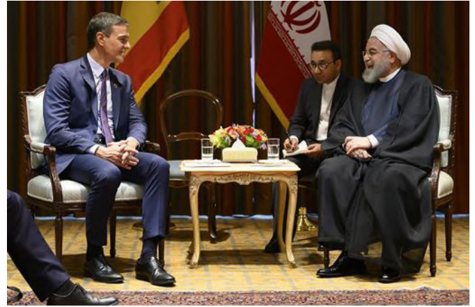
El presidente español Pedro Sánchez y el anterior presidente de Irán Hassan Rouhani, en el marco de la Asamblea General de la ONU.- Nueva York, 24 septiembre de 2019.