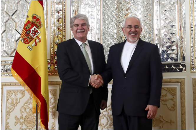
El anterior ministro español de Asuntos Exteriores, D. Alfonso Dastis, junto a su entonces homólogo iraní, Mohamad Yavad Zarif. Teherán, 21 de febrero de 2018.