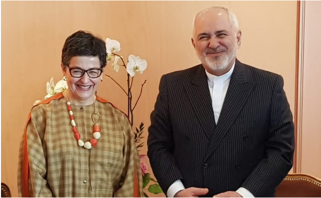
La anterior ministra española de Asuntos Exteriores Dña Arancha González junto a su entonces homólogo iraní Javad Zarif.- Munich, febrero 2020.